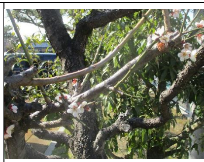
白梅 白い梅ですが、つぼみが少なく、あまり咲いていません。