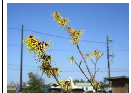
マンサク ビオトープにある早春を代表する黄色い花です。