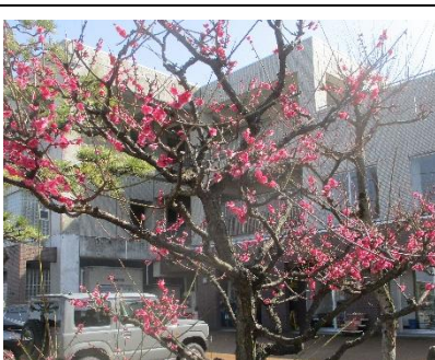
紅梅 ピンクの梅の花です。総合体育館側に紅白で1対あります。