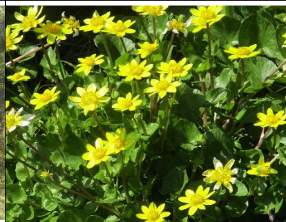
ヒメリュウキンカ 植えていないのにすごく増えています。