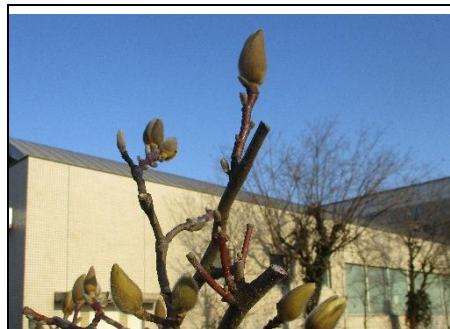
コブシ 旧大門町の花です。つぼみの先が割れてきました。白い花が咲きます。